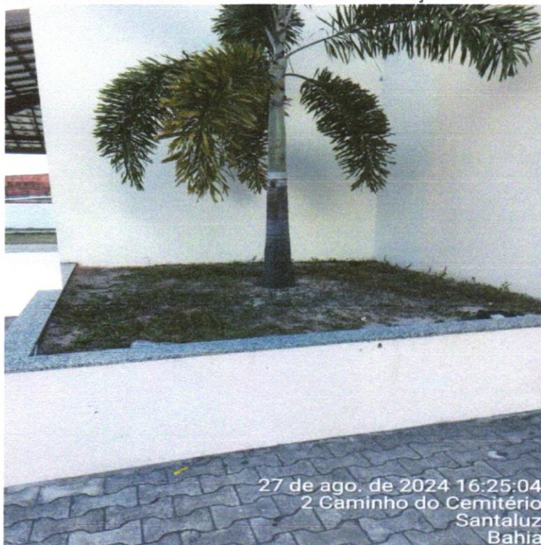
FOTO 08: FORNECIMENTO E PLANTIO DE VEGETAÇÃO ORNAMENTAL AF_11/2017