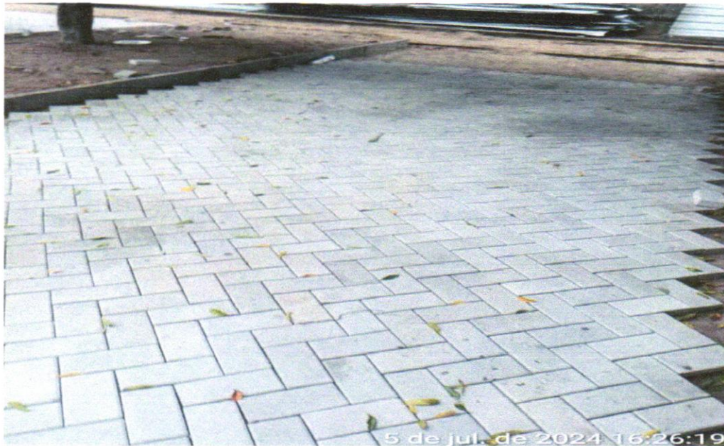
FOTO 04: Pavimentação em bloco de concreto vibroprensado, intertravado, colorido, 10x20cm, e=6cm, 46un/m 2 , NBR9781, Fck(min)=35MPa, sob coxim areia grossa compactada c/ placa vibratória, e(comp.)=6cm, rejuntado c/ areia fina

FOTO 03 : Pavimentação em bloco de concreto vibroprensado, intertravado, cor natural, 10x20cm, e=6cm, 46un/m 2 , NBR9781, Fck(min)=35MPa, sob coxim areia grossa compactada c/ placa vibratória, e(comp.)=6cm, rejuntado c/ areia fina